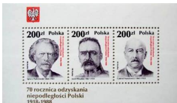
(Blok 93 70. rocznica odzyskania niepodległości Polski 1918-1988. Fi 3026 Paderewski, 3027 Piłsudski, 3028 Narutowicz)

Ochotnicy częstochowscy dotrzymywali słów przysięgi walcząc i umierając za Ojczyznę pod Lwowem i Wilnem, w obronie Warszawy i nad Niemnem.