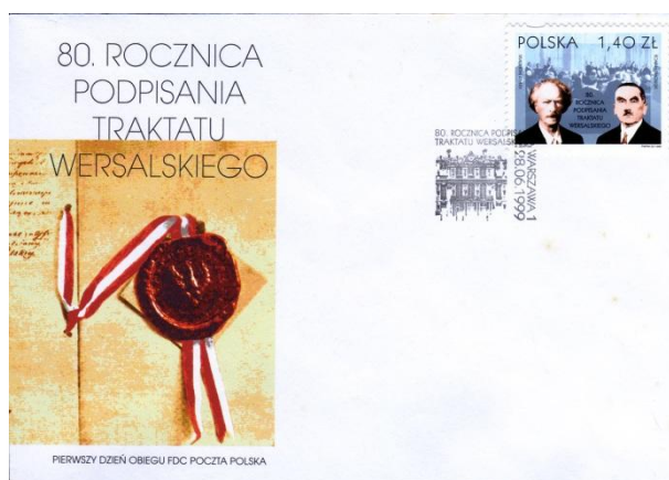
FDC S-1122 i Fi 3629, 80 rocznica podpisania Traktatu Wersalskiego

Traktat wersalski został zawarty podczas paryskiej konferencji pokojowej, trwającej od 18 stycznia 1919 roku do 21 stycznia 1920 roku. Brało w niej udział 27 zwycięskich państw. Polska była reprezentowana przez Ignacego Paderewskiego, Romana Dmowskiego oraz Władysława Grabskiego. Państwa pokonane w I wojnie światowej (Niemcy, Austro-Węgry, Turcja, Bułgaria) nie zostały dopuszczone do konferencji. Przedstawiono im tylko traktaty do podpisania. Rosja Radziecka nie została zaproszona, gdyż mocarstwa Ententy nie uznawały rządu bolszewickiego, który podpisał osobny pokój z Niemcami w 1918 roku (pokój brzeski).