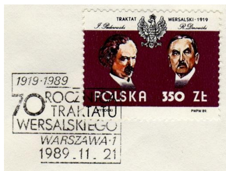
Fi 3083 70 rocznica podpisania Traktatu Wersalskiego

jednego tematu – rocznicy podpisania Traktatu Wersalskiego. Emisja 21 listopada 1989 roku - 70 rocznica podpisania Traktatu Wersalskiego i 28 czerwca 1999 roku - 80 rocznica podpisania Traktatu Wersalskiego