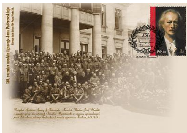
Koperta FDC przedstawiająca Ignacego Paderewskiego z żołnierzami „Kadrowki” (S-1526)

Od 16 stycznia 1919 roku do 9 grudnia 1919 roku pełnił funkcję premiera i ministra spraw zagranicznych. W czerwcu 1919 roku podpisał w imieniu Polski traktat wersalski. W latach 1920-1921 stały przedstawiciel Polski w Lidze Narodów. Następnie wycofał się z życia politycznego. W 1936 roku, wraz z W. Sikorskim, założył Front Morges.