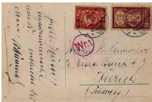
Fi 108 i Fi 107 Sejm Ustawodawczy, frankatura dwukolorowa, widokówka wysłana 21.I.1920 z Warszawy do Zurychu, stempelek cenzury warszawskiej "Wr.1."

Korzystając z okazji, chciałbym dalej podążać za naszym wybitnym patriotom i jego miejscu w polskiej filatelistyce. Zacznę od wydania serii znaczków z 15 czerwca 1919 roku pt. Pierwsza sesja Sejmu Ustawodawczego. W skład serii wchodzi siedem znaczków. Ignacy Paderewski znajduje się na znaczku Fi 108.