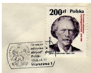
Ignacy Paderewski na zn Fi 3026

odzyskania niepodległości przez Polskę. (Fi 3021 – 3028)