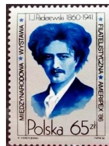
Znaczek Fi 2879 Międzynarodowa Wystawa Filatelistyczna „Ameripex '86”

22 maja 1986 roku został wydany znaczek Fi 2879 z okazji Międzynarodowej Wystawy Filatelistycznej „Ameripex '86” która odbyła się w Chicago.