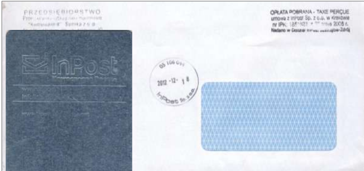
Przesyłka listowa o łącznej masie ponad 50 g (2 arkusze A4 w kopercie obciążonej blaszką 65,0 x 82,5 x 1,2 mm o masie 48,0 g) nadana w Oddziale InPost w Jastrzębiu Zdroju w dniu 18. 12. 2012 r.

Z dniem 1. stycznia 2013 roku, w wyniku kolejnej liberalizacji rynku pocztowego w Polsce, zaistniała możliwość przewożenia bez ograniczeń wszystkich listów przez wszystkich operatorów pocztowych. Zniknęły znane z przesyłek niektórych operatorów blaszki, notesiki czy inne obciążenia powodujące, że masa listu przekraczała 50g i tym samym omijane było obowiązujące do końca 2012 roku ograniczenie : wyłączność PP SA na przewożenie listów o masie do 50 g.