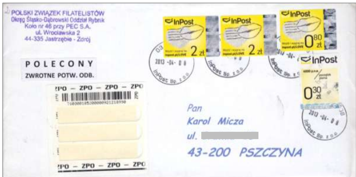
List polecony z potwierdzeniem odbioru, nadany w punkcie InPost w Jastrzębiu Zdroju (ul. Arki Bożka) w poniedziałek 8.04.2013,