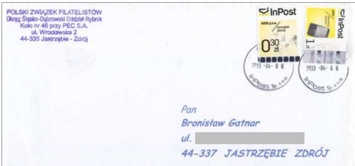
List nierejestrowany lokalny, nadany w punkcie InPost w Jastrzębiu Zdroju (ul. Warszawska) 8. 04. 2013, doręczony 10. 04. 2013 r. Oplata 1,30 zł.