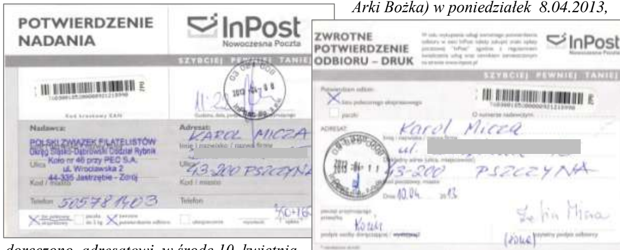
doręczono adresatowi w środę 10. kwietnia, natomiast potwierdzenie odbioru dotarło do nadawcy we wtorek, 16. kwietnia 2013 roku.