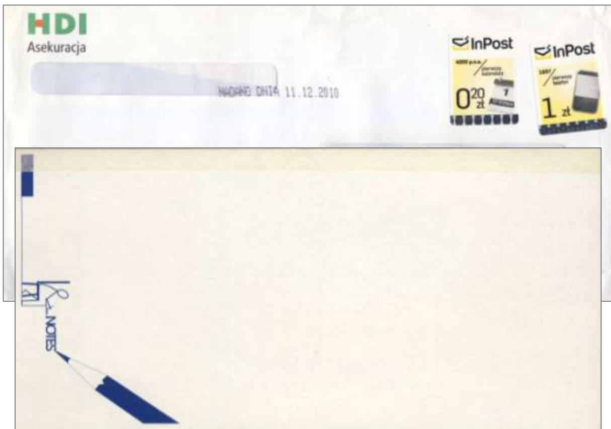
Przesyłka listowa o łącznej masie ponad 50 g (w kopercie kilka arkuszy A4 oraz notes o wym. 100x205x3,3 mm i masie 41 g) nadana w dniu 11.12.2010 r. do adresata w Jastrzębiu Zdroju.