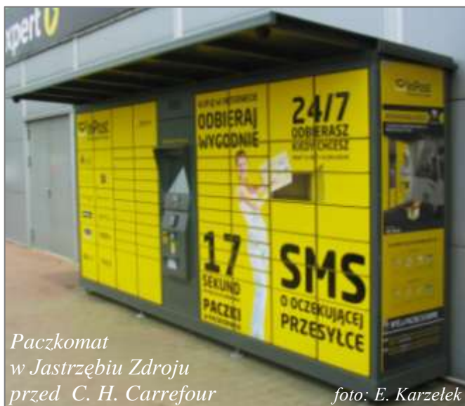
Paczkomat w Jastrzębiu Zdroju przed C. H. Carrefour

InPost jest pomysłodawcą i właścicielem ogólnopolskiej sieci Paczkomatów - systemu skrytek pocztowych umożliwiających całodobowy odbiór i nadawanie paczek w dogodnym miejscu i lokalizacji. Obecnie firma prowadzi ekspansję sieci na rynkach zagranicznych w ramach międzynarodowej marki EasyPack - do końca 2016 roku pragnie uruchomić 16 000 Paczkomatów InPost w Europie i Wspólnocie Niepodległych Państw. Projekt, realizowany wspólnie z Pine Bridge Investments, wyceniany jest na 300 mln euro!